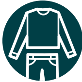
Vêtements amples et couvrants