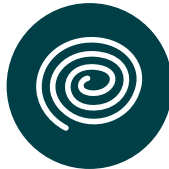
Serpentins à l'extérieur